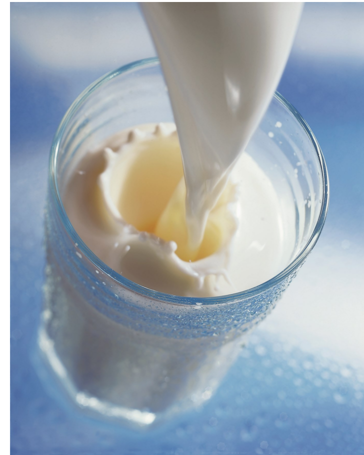
Stand: Februar 2015

Quellen: aid infodienst Ernährung, Landwirtschaft, Verbraucherschutz e.V. BMWi - Bundesministerium für Wirtschaft und Technologie Bundesagentur für Arbeit Milchindustrie-Verband e.V.